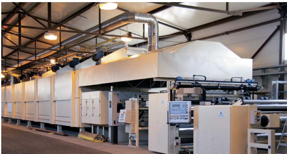
Линия по пропитке

«Ханс Шмид Декор» намерен начать активное освоение и новых географических рынков. Сейчас постоянными клиентами компании являются крупные производители Северо-Западного региона. С вводом в эксплуатацию новой линии компания намерена усилить при-